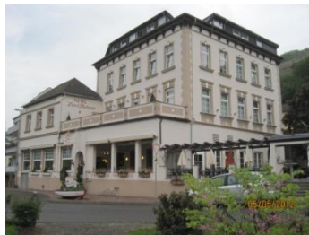
Hotel Zwei Mohren

På vores rejse i Hildegards fodspor, fra barndommen og til hendes død i 1179, boede vi på hotellet Zwei Mohren i Assmannshausen ved Rüdesheim, med udsigt til Rhinen.