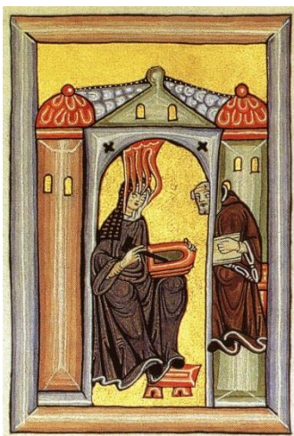
Det levende lys

Hildegard fik gennem hele sit liv visioner ved højlys dag. Hun opfattede sig selv som Guds talerør, "Guds basun", med den profetiske opgave at rense og reformere Kirken. Hendes åbenbaringer blev bedømt på et kirkemøde i 1147, og Paven godkendte hendes visioner som ægte guddommelige åbenbaringer i pagt med Bibelen og Kirkens lære. Paven pålagde hende derfor at udbrede, hvad Gud lod hende se og høre, og herefter bredte hendes ry som kristen profet sig ud over hele Europa.