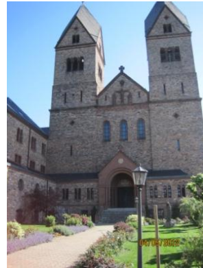
Abtei St. Hildegard

Hildegard spænder meget vidt og har efterladt sig et stort forfatterskab inden for teologi, filosofi, lægekunst og naturvidenskab. Derudover rejste hun rundt som prædikant og nød stor indflydelse som personlig rådgiver for både kejsere og paver, konger og kirkemænd og mange andre.